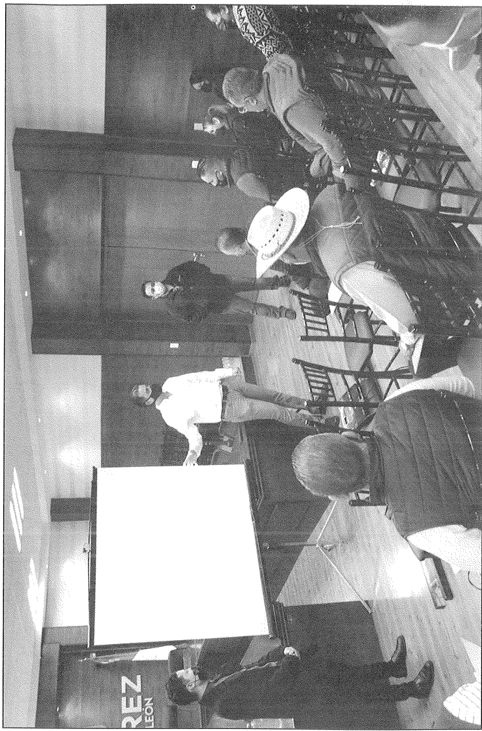
El alcalde dialogó con los futuros inspectores.

onia Los a realizar e mencio- las estos las Colo- Cometas, ej Villa del